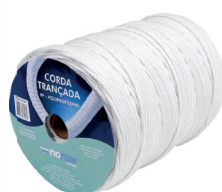
Cód. 3333 - Corda Branca Trancada Polipropileno 3,5mm Riomar 110302

100% Polipropileno. Trançada/ Multifilamento/ Com Aditivo U.V. Diâmetro: 1,5 à 25 mm. Cor: Branca