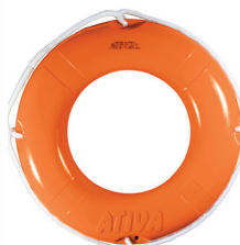
Cód. 15173 - Boia Salva Vidas Laranja Classe III s/ Refletivo 60 cm

Boia salva-vidas circular rígida para embarcações de mar aberto que operem exclusivamente sob jurisdição nacional. Carga de ruptura mínima: 500Kg. Confeccionada em polietileno fundido com proteção UV e preenchimento interno de poliuretano expandido. Material imputrescível, resistente a fungos, água do mar, água doce, petróleo e seus derivados.