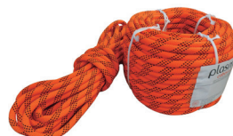
Corda Semi-Estatica P48F - Tipo A - NBR 15986:2011

Fabricante: Riomar Tamanho: Rolo com 169mts