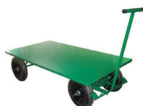
Cód. 3357 - Carrinho Plataforma Aço

Com Pneu e Câmera. Capacidade: 200kg. Roda pneumática 325" x 8.