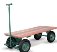
Cód. 7440 - Carrinho Plataforma Madeira

Carro plataforma c/ metal e rodas pneu e câmara. Capacidade 800 kg.