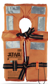
Cód. 15305 - Colete Salva Vidas Laranja Classe II Canga c/ Refletivo (Acima de 100KG)

Boia salva-vidas circular rígida para embarcações de mar aberto que operem exclusivamente sob jurisdição nacional. Carga de ruptura mínima: 500Kg. Confeccionada em polietileno fundido com proteção UV e preenchimento interno de poliuretano expandido. Material imputrescível, resistente a fungos, água do mar, água doce, petróleo e seus derivados.