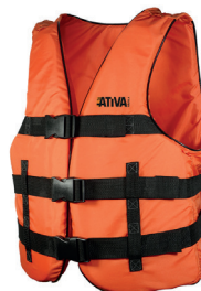
Cód. 8112 - Colete Salva Vidas Laranja Classe IV Jaleco Nylon Fino s/ Refletivo (40KG ATE 130KG)

Desenvolvido para uso em trabalhos de longa duração, realizados próximos à borda de embarcações, cais ou construções que apresentem risco de queda em águas calmas. Fitas refletivas Solas. Ombreiras reforçadas: Costura em "X". Acabamento em vinil preto para maior conforto e durabilidade. Fabricado com tecido poliéster grosso e espuma de polietileno de célula fechada.