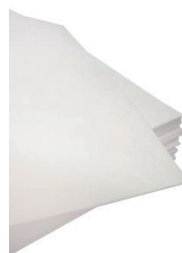
Manta Absorvente Branca Sintética

Fabricante: Diversos Tamanho: 3m x 3m x 2,5