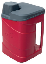
Cód. 3344 - Garrafa Térmica