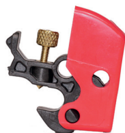
Cód. 10709 - Dispositivo de Bloqueio Universal de Disjuntor

Indicadas para bloqueio e travamento de válvulas e disjuntores em geral; Revestidas em plástico isolante elétrico na cor vermelha. Fabricadas em Aço revestida com banho protetor em zinco branco; Podem ser usados até 6 cadeados simultaneamente.