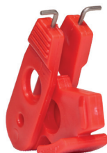
Cód. 10708 - Dispositivo de Bloqueio Universal de Disjuntor Din

Dispositivo com capa de plástico ABS vermelho e base de Nylon rígido preto; Parafuso de latão de fixação manual, sem necessidade de chave de fenda; Orifício para colocação do cadeado frontal ou lateralmente; Atende manoplas com dimensões de até 8mm largura x 13mm comprimento.