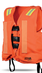
Cód. 4978 - Colete Salva Vidas Laranja Classe IV Jaleco p/ Soldador (40KG ATE 130KG)

Desenvolvido para uso em trabalhos verticais realizados próximos à borda de embarcações, cais ou construções que apresentem risco de queda na água. Patente requerida. Fitas refletivas Solas. Acabamento em vinil preto para maior conforto e durabilidade. Informações de classe e cuidados de uso na parte interna do colete. Porta- Rádio no ombro esquerdo. Fabricado com tecido poliéster grosso, e espuma de polietileno de célula fechada.