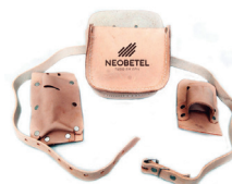
Cód. 3378 - Cinto de Carpinteiro