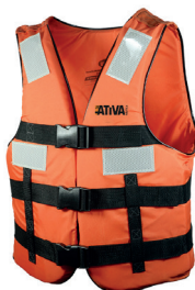
Cód. 20722 - Colete Salva Vidas Laranja Classe IV Jaleco Nylon Fino c/ Refletivo (40KG até 130KG)

Para embarcações de mar aberto que operem exclusivamente em território nacional. Fitas refletivas Solas. Informações de classe e cuidados de uso na parte interna do colete. Esse modelo desvira uma pessoa desacordada em até 5 segundos. Fabricado com tecido poliéster grosso, e espuma de polietileno de célula fechada.