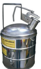
Cód. 5249 - Container Anti Explosão Aço Inox T1

Podem ser usados em qualquer tipo de superfície. Alta capacidade de absorção. Seletividade - absorve óleos, diesel, gasolina, solventes orgânicos, óleos vegetais e líquidos não-aquosos enquanto repele água.