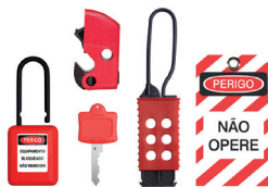
Cód. 20148 - Kit de Bloqueio de Disjuntor Motor/ Din/ Nema e Caixa Moldada

Composto por: Cadeado de Bloqueio Plástico Haste Alumínio 6,3 mm de Espessura e 38 mm de Altura (11/2); Prensa cabo plástico 6 furos; Garra de bloqueio e travamento em aço - 25,4 mm / 1"; Etiqueta de identificação; Dispositivo de Bloqueio Universal; Cabo de aço de 4,8 mm de diâmetro revestido de PVC. Disponível em 5 medidas: 1 m, 1,8 m, 2 m, 2,4 m e 3 metros.