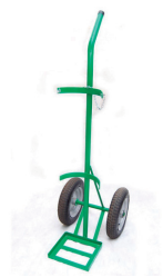
Cód. 3380 - Carrinho para 1 Cilindro

Fabricante: Valcar Tamanho: 1400 x 300 x 300 mm