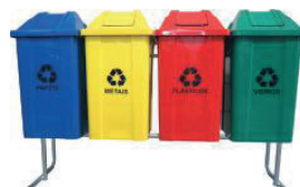
Kit Coleta Seletiva

Utilizado para transporte e armazenamento de líquidos inflamáveis e combustíveis. Disponível em outras capacidades.