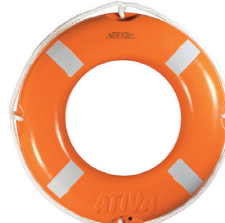
Cód. 5266 - Boia Salva Vidas Laranja Classe II c/ Refletivo 60 cm

Boia salva-vidas circular rígida para navegação em águas abrigadas como; rios, lagos, represas e etc. Carga de ruptura mínima: 500Kg. Confeccionada em polietileno fundido com proteção UV e preenchimento interno de poliuretano expandido. Material imputrescível, resistente a fungos, água do mar, água doce, petróleo e seus derivados.