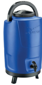
Cód. 3343 - Garrafa Térmica com Torneira

Novo Design, mais compacto e funcional. Alça embutida. Para líquidos quente e frio.