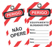
Cód. 22781 - Cartão Bloqueio Flexível s/ Filme Cód. 24140 - Cartão Bloqueio Flexível c/ Filme

O Dispositivo de Bloqueio para Disjuntor Norma DIN pode ser usado como trava para disjuntores norma DIN monopolar, bipolar e tripolar. Para Disjuntores Norma DIN bipolar e tripolar modelo SIEMENS, utilizar o DBU (Dispositivo de Bloqueio Universal).