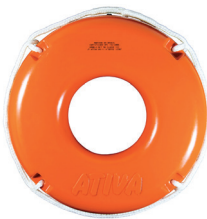
Cód. 17140 - Boia Salva Vidas Laranja Classe III s/ Refletivo 50 cm

Fabricante: JT Ativa Ref. Fabricante: BCT50