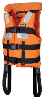
Cód. 18034 - Colete Salva Vidas Laranja Classe II Jaleco c/ Refletivo (55KG a 110KG)

Para embarcações de mar aberto que operem exclusivamente em território nacional. Dobra larga nos ombros para maior conforto e ergonomia. Informações de classe e cuidados de uso estampados no colete. Desvira uma pessoa desacordada em até 5 segundos. Mantém a boca do usuário mais de 12 cm para fora d'água. Fabricado com tecido poliéster grosso e espuma de polietileno de célula fechada.