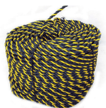
Cód. 3352 - Corda De Sinalização Torcida Preto/Amarelo

Fabricante: Dis Corda Tamanho: 12mm Rolo c/ 220 mts