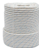
Cód. 3107 - Corda Poliamida Bombeiro 12mm Plasmodia 5711

Fabricante: Dis Corda Tamanho: 12mm Rolo c/ 220 mts