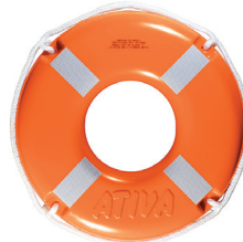
Cód. 14195 - Boia Salva Vidas Laranja Classe II c/ Refletivo 60 cm

Boia salva-vidas circular rígida para navegação em águas abrigadas como; rios, lagos, represas e etc. Carga de ruptura mínima: 500Kg. Confeccionada em polietileno fundido com proteção UV e preenchimento interno de poliuretano expandido. Material imputrescível, resistente a fungos, água do mar, água doce, petróleo e seus derivados.