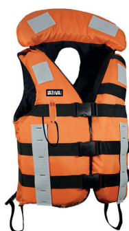
Cód. 3560 - Colete Salva Vidas Laranja Classe IV Jaleco Nylon Grosso c/ Refletivo c/ Lâmpada (40KG até 130KG)

Desenvolvido para uso em trabalhos de longa duração, realizados próximos à borda de embarcações, cais ou construções que apresentem risco de queda em águas calmas. Ombreiras reforçadas: Costura em "X". Acabamento em vinil preto para maior conforto e durabilidade. Fabricado com tecido poliéster grosso e espuma de polietileno de célula fechada.