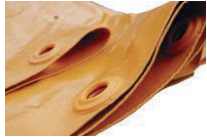
Lona PVC Cargo Light Preta x Laranja

Cores disponíveis: Vermelha e Azul. Conserva por até 6 horas; Tripé retrátil; Alça e bocal largos; Isolamento com espuma de poliuretano e dupla camada de polietileno.