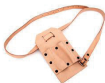
Cód. 3089 - Cinto de Amarrar Porta Chave Torques

Cintos e Porta-Chave feito a base de couro cru. Os mesmos são utilizados para o melhor conforto e desenvolvimento do operador em seu trabalho.