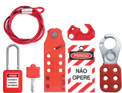
Cód. 19476 - Kit de Bloqueio de Válvula Esfera / Registro (Gaveta) / Borboleta